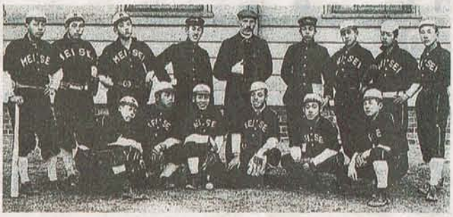
黒いユニホームを着た明星商の選手たち